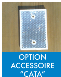
OPTION ACCESSOIRE "CATA"